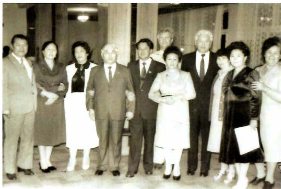
Петропавловск. 1982 год