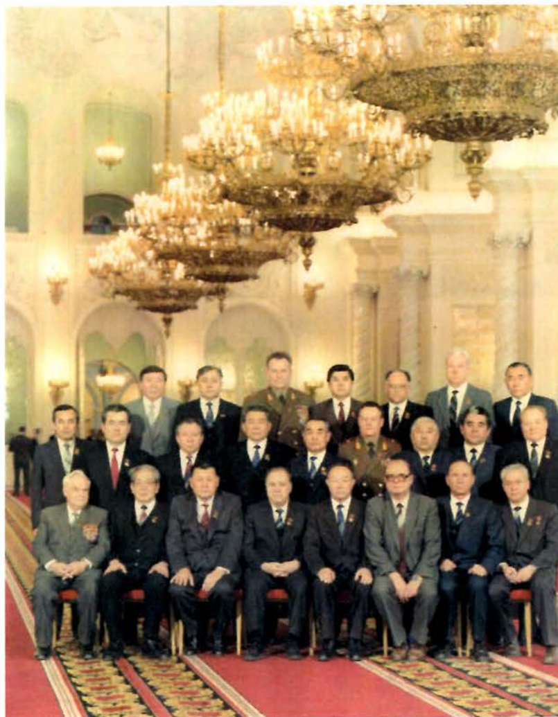
XXVII съезд КПСС. Москва, Кремль. 1986 год