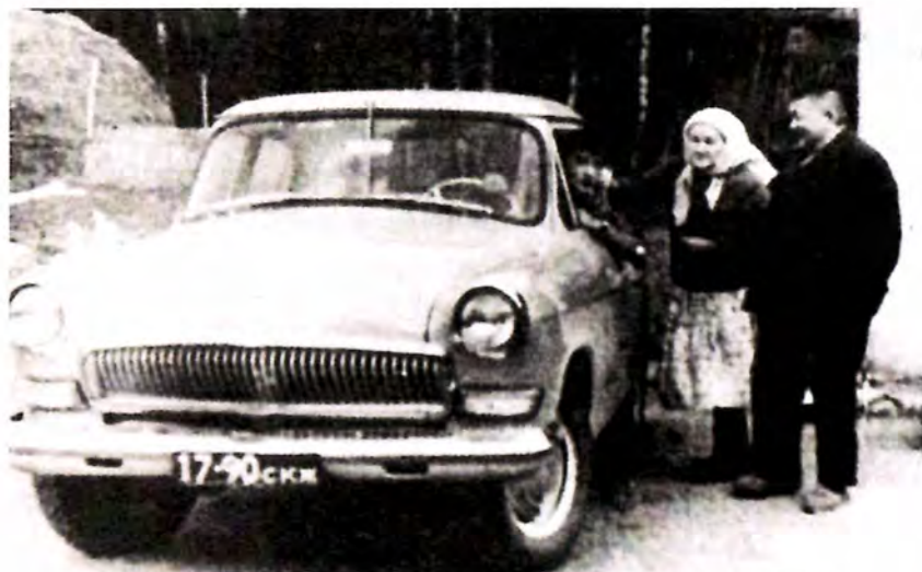
Ақын жұбайымен 60 жылдық мерейтойға сыйға тартылған «Волга» машинасын көруде