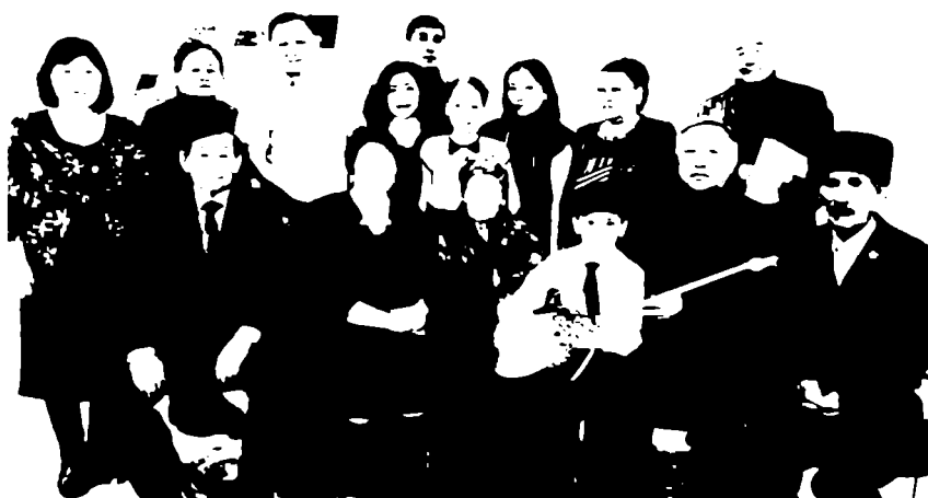
110-жылдық мерейтойына арналған конференция

Енді біздің қолдан келетіні тілек: Ахаңның қалған балалары, немерелері, шөберелері аман болсын дейміз. Жалпы еліміз аман болып, Аханды білетіндеріміз өміріміздің аяғына дейін өңіріміздің дара туған асылын еске алып жүруге жазсын. Атамның өзі кетсе де, халқына сіңірген еңбегі кетпесін.