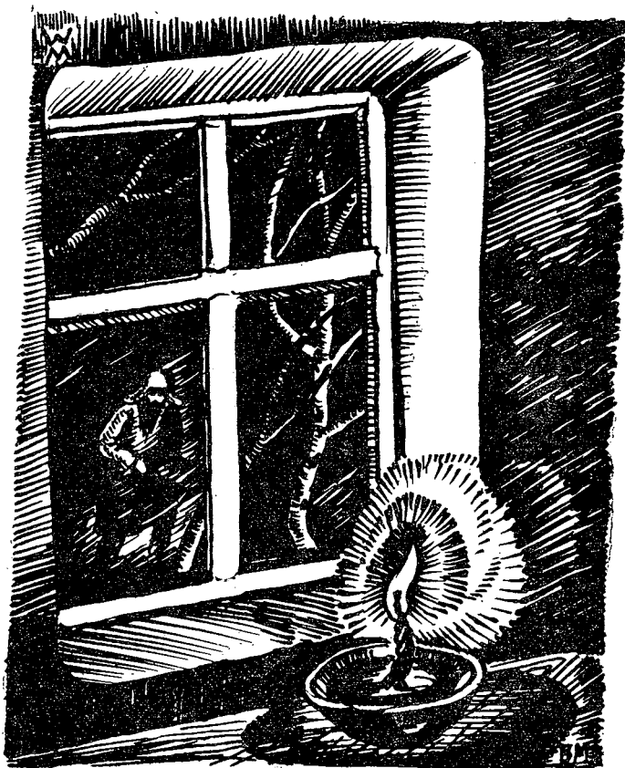
СВЕЧА В УРАГАННОЙ НОЧИ.