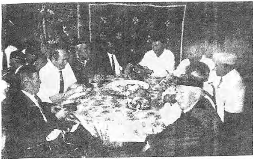
Суретте Тоқсан би бейітінің басына ескерткіш орнатуға арналған ас дастарханынан көрініс.