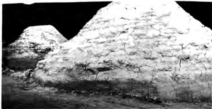
Ботайдан табылған ежелгі адамдар қонысы (қалпына келтірілген)

Қазақ даласы, Моңғол жерінен бастап Жайық пен Сырдарияға дейінгі аралық, әскери-саяси тарихтың бел ортасында болды.