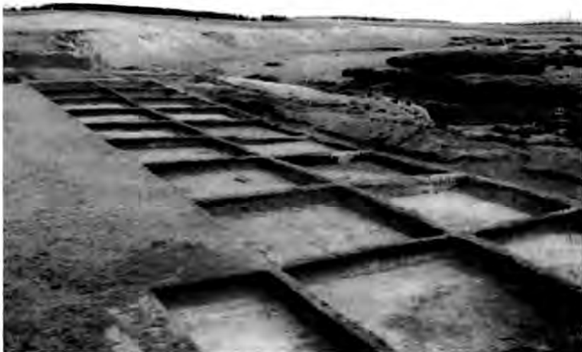
Ежелгі Ботай қонысының орны

Тоқсаныншы жылдары Ботайда шетел ғалымдарының үлкен жиыны өтті. Оған жиырмадан астам мемлекет ғалымдары келіп қатысты. Оның ішінде АҚШ, Англия, Германия, Қытай, Польша және Иран сияқты елдердің өкілдері Ботай мәдениеті жайлы тарихи деректерге негізделген пікірлер білдірді. Осылайша шетел ғалымдары жер астынан табылған адам мен жылқының сүйектерін саралай келіп, ежелгі адамдар бұл өлкеде 5300 жыл бұрын өмір сүрді деген тұжырымға келді. Ал жылқының қолға үйретілгенін былай қойып, оның өз тамағын қар астынан өзі тауып жейтіні ғалымдардың қызығушылығын тудырған еді. Ғалымдардың бұл пікірлері көптен бері жылқы мен адам арасындағы байланыстың жұмбақ күйінде қалған тұстарын ашуға негіз болды. Себебі, жылқы түлігін біздің бабаларымыз басқа халықтарға қарағанда ең алғашқылардың бірі болып қолға үйреткенін дәлелдеуге Ботайдан табылған жәдігерлер айқара жол ашты. Ботай ежелгі жылқы өсірушілердің үнемі қоныстанатын орны болған.