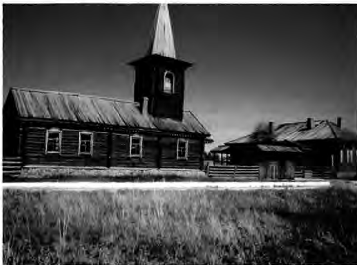
Сырымбеттегі Айғаным қонысы

Сырымбет ауылындағы XIX ғасырдың үлгісімен салынған «Айғаным қонысы» да өңіріміздің ғажайып ескерткіштерінің бірі. Айғаным отырықшы өмірдің пайдасын түсініп, өз қыстағын орыс инженерлерінің сәулет үлгісімен салғызған. Сырымбеттегі Айғаным қонысында үйден бөлек, мектеп, мешіт, қонақ үй, диірмен, монша және түрлі шаруашылыққа қажет құрылыстар болған.