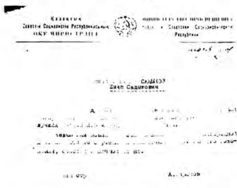
Оқу министрлігінің құттықтау хаты.