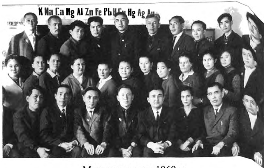
Мектеп ұжымы. 1969 ж.