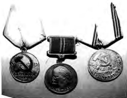
Еңбектегі ерлігі үшін алған медальдар