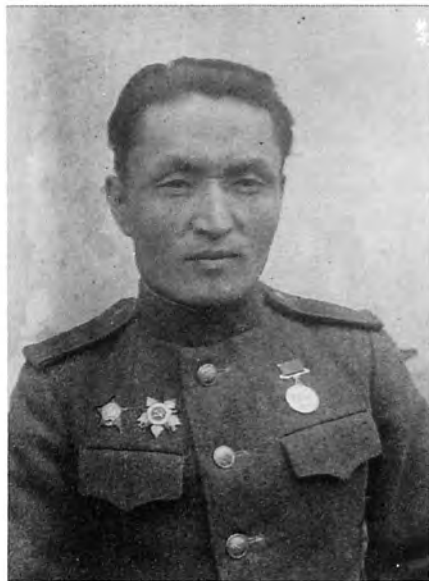
Жеңіс жақын. 3.05.1945 ж.