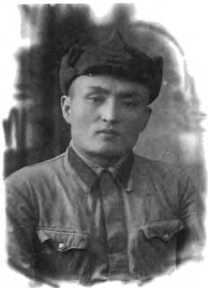
Шияптың әскерге алынған кезі.