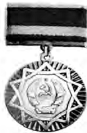
ҚР еңбек сіңірген мұғалім белгісі