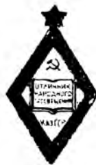
ҚР оқу ісінің озаты белгісі