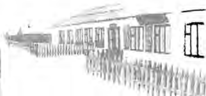
Ауыл көрінісі және шаруашылық кеңсесі

1930 жылы осы үш шаруашылық біріктіріліп, бір ұжымдық шаруашылыққа көшкен, оны “Мәдениет” деп атайды. Аудан орталығы алғаш Казгородок болыпты.