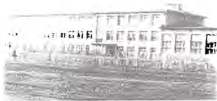
Бүгінгі мектеп үйі

Жалпы алғанда бұл елді Құдайберді, Бәйімбет рулары деп атайды. Есілдің екі қанатын алып жатқан қалың ел. Қазан төңкерісі, Кеңес үкіметі келген кезде тарыдай шашылып тарап, бет-бетімен бөлініп кеткен екен. Ұжымдастыру мен аштық жылдары (29,30) әркім өз күнкөрісін ойлап жан-жаққа тағы бытыраған.