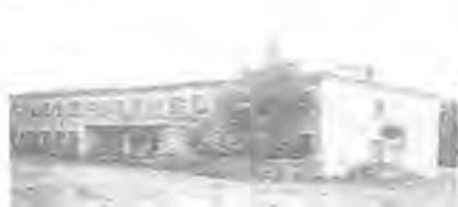
Мектеп жанындағы интернат үйі