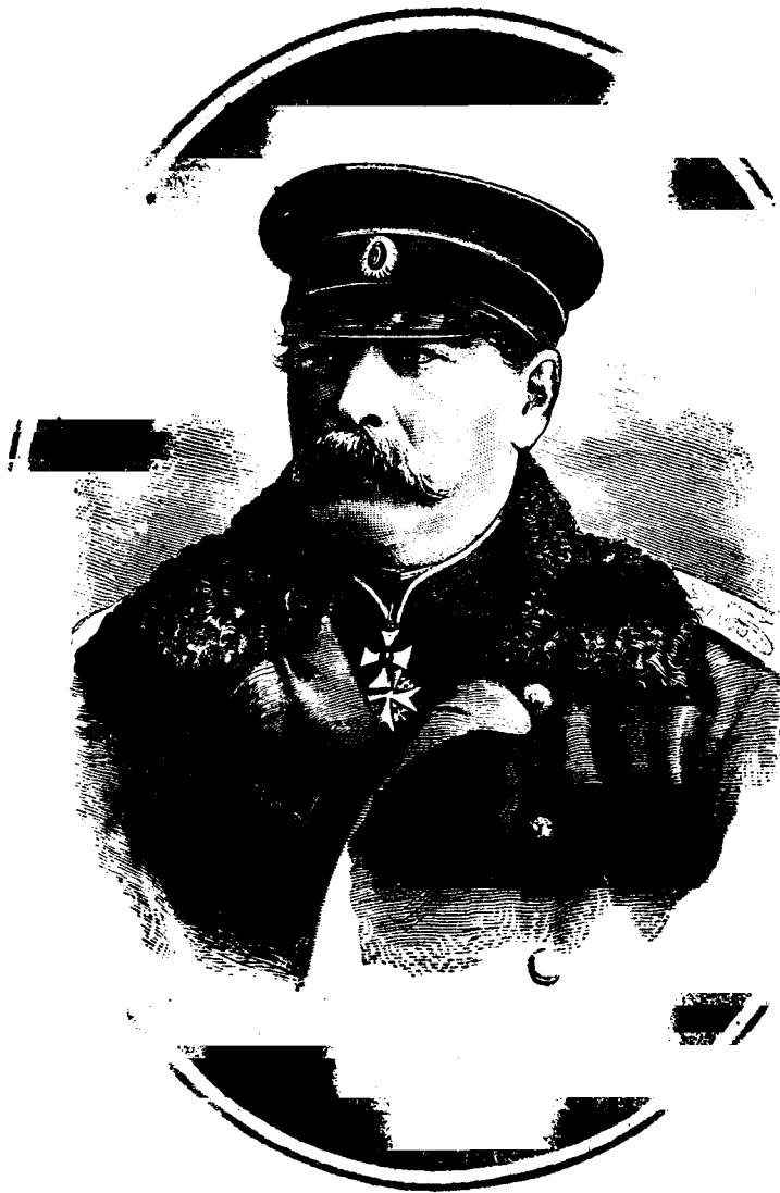
Фото-Литография Шереръ, Набгольцъ и К о въ Москвѣ

ГЕНЕРАЛЬ-АДЪЮТАНТЪ Э. И. ТОТЛЕБЕНЪ, ТОВАРИЩЪ ГЕНЕРАЛЬ-ИНСПЕКТОРА ПО ИНЖЕНЕРНОЙ ЧАСТИ.