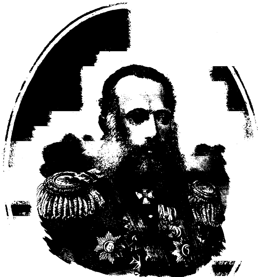
Фото-Литография Шереръ, Набголицъ и К о въ Москвѣ.

ГЕНЕРАЛЬ-ЛЕЙТЕНАНТЪ ГЕЙМАНЪ, «ГЕРОЙ ДНЯ» ВЗЯТІЯ АРДАГАНА, 5-ГО МАЯ.