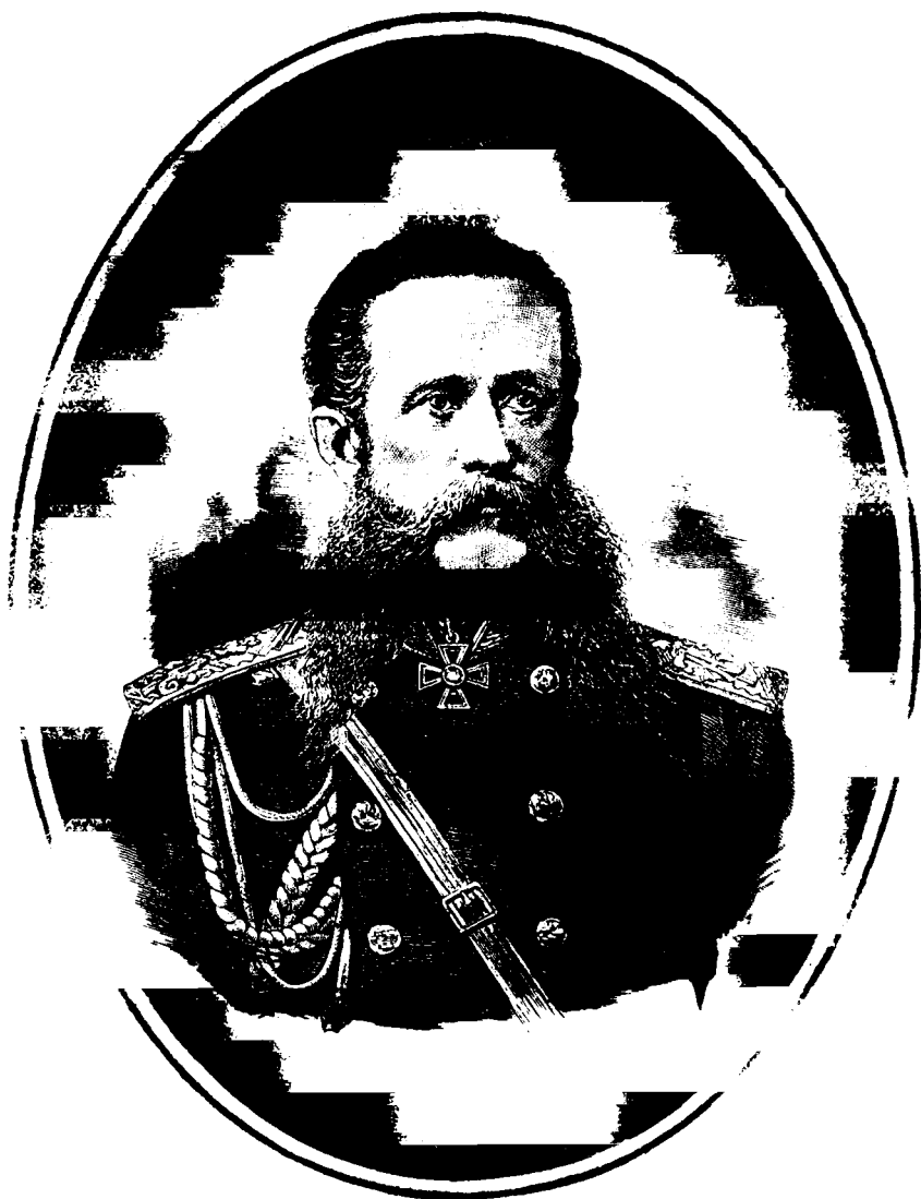
Фото-Литография Шереръ, Наблюдать и К о въ Москвѣ.

ГЕНЕРАЛЬ-АДЪЮТАНТЪ, ГЕНЕРАЛЬ ЛЕЙТЕНАНТЪ І. В. Гурко , начальниѣкъ РУССКАГО АВАНГАРДА, ПЕРЕШЕДШІЙ БАЛКАНЫ.