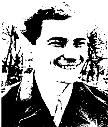
Студент Историко-архивного института. Москва. 1954 г.