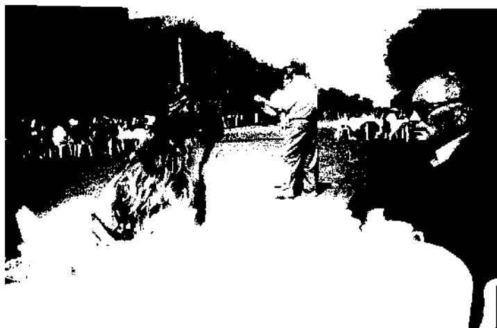
Праздник улицы Интернациональной. 8 июля 2000 года