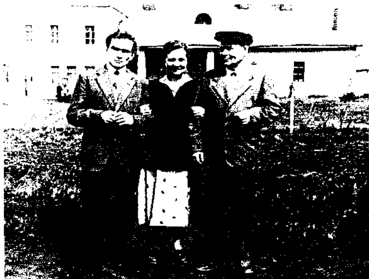
Из Москвы на выходные к родителям (г. Жуков - родина Маршала). 1958 г.