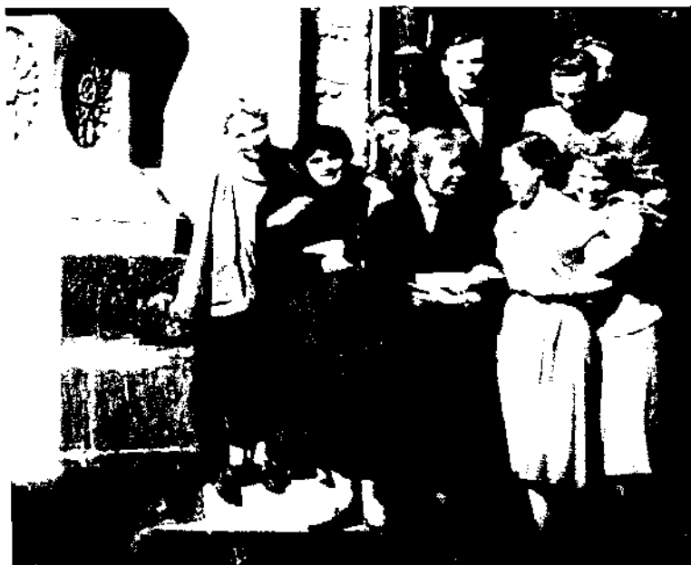
Группа четвертого курса МГУ-АИ. г. Москва. 1957 г.