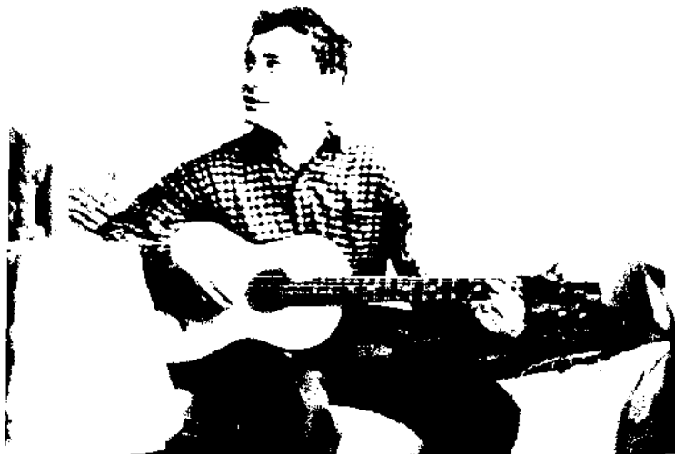
Студенческие годы... В общежитии МГИ-АИ. Москва. 1958 г.